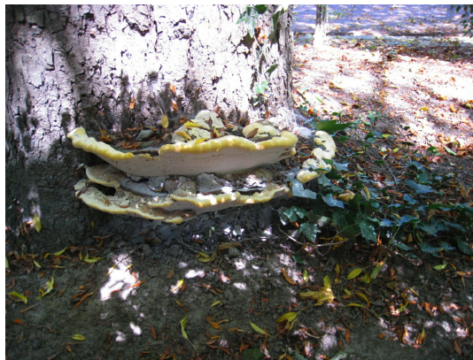
, 29 Juillet 2008