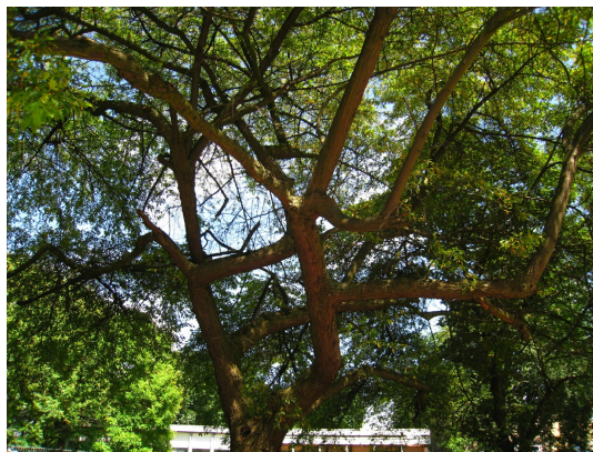
, 29 Juillet 2008